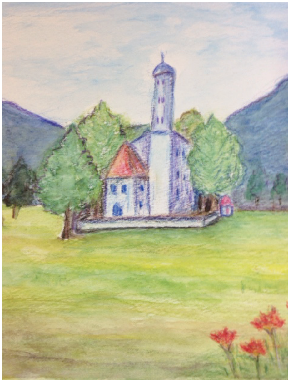
画：横構幸子さん「野辺の教会」